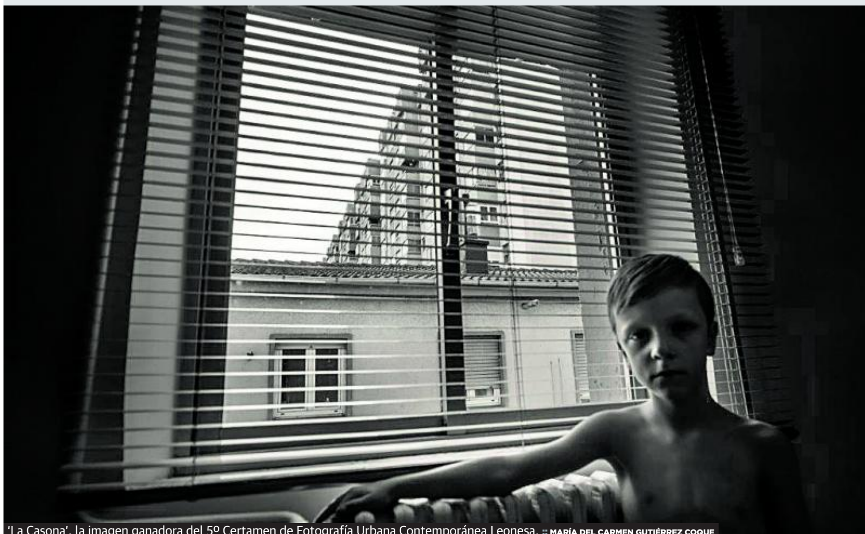
'La Casona', la imagen ganadora del 5º Certamen de Fotografía Urbana Contemporánea Leonesa.