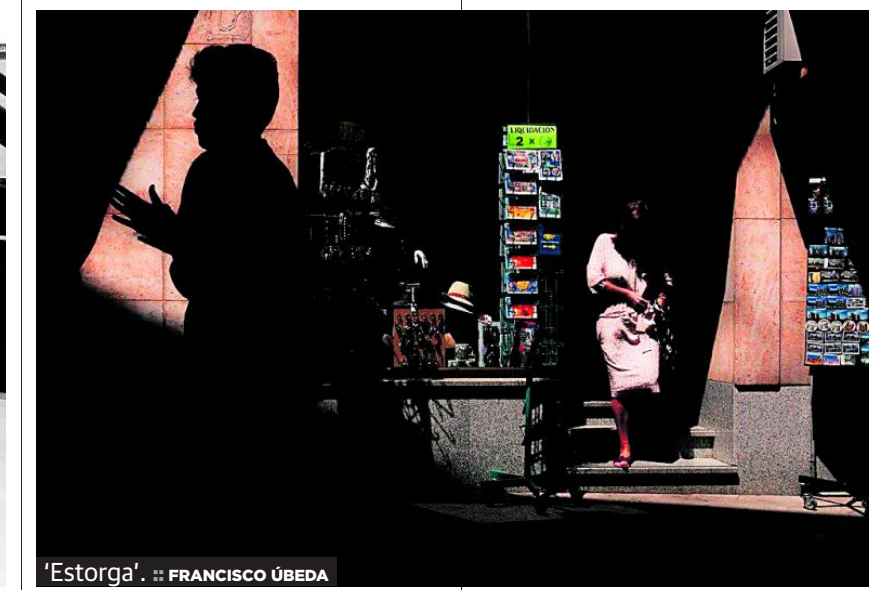
'Estorga'. :: FRANCISCO ÚBEDA