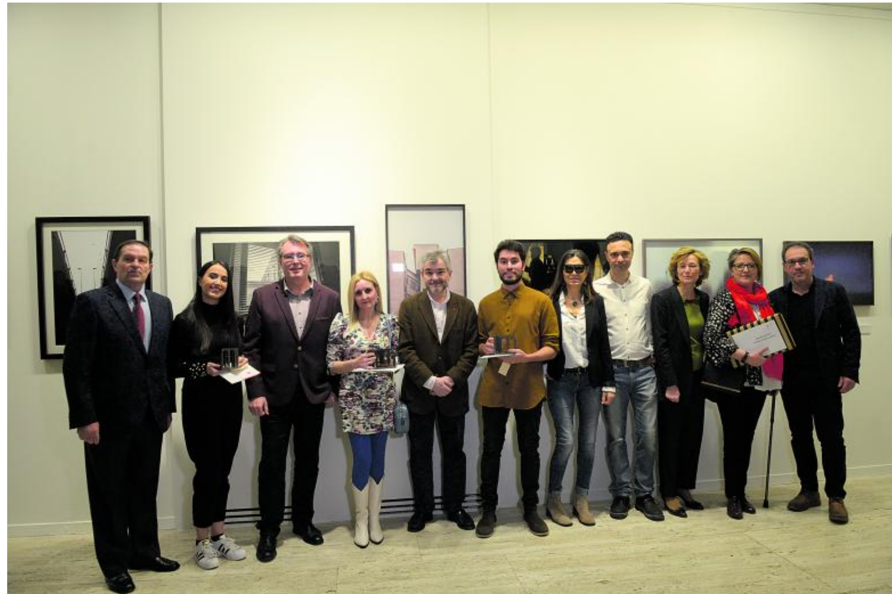
Foto de familia de los representantes de la Cámara de la Propiedad Urbana de León y miembros del jurado con los ganadores del certamen.