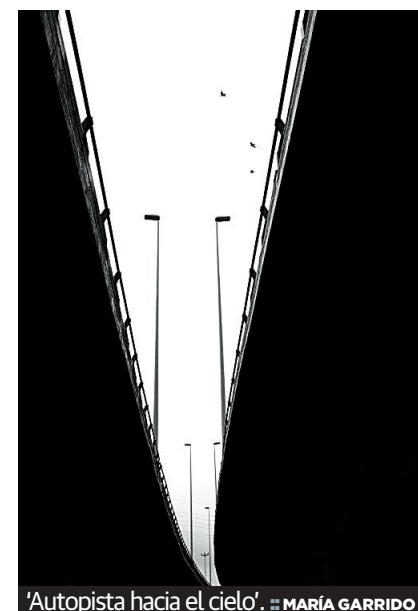
'Autopista hacia el cielo'.