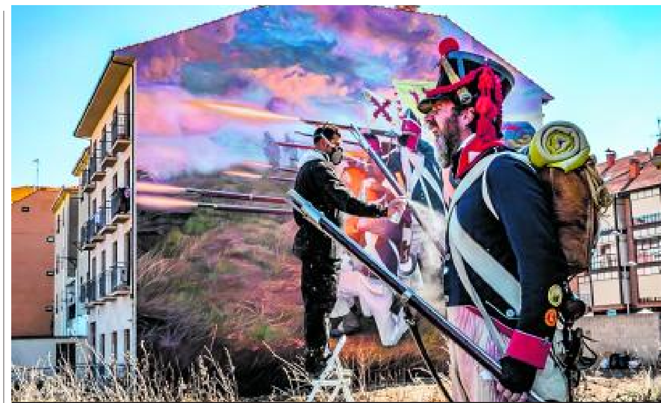
Imagen de la muestra producida por la Cámara de la Propiedad Urbana 'Arte urbano, graffittis y algo más'.

ME SIGUE GUSTANDO EL CHOCOLATE "LA CEPEDANA"