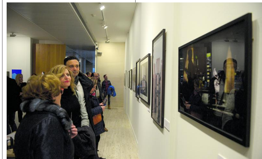
Numeroso público se congregó en el Museo de León.