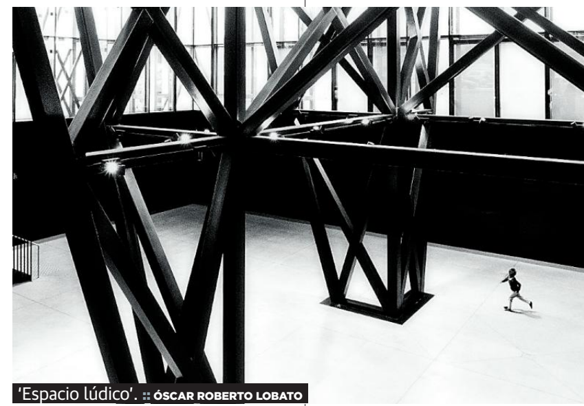
'Espacio lúdico'.