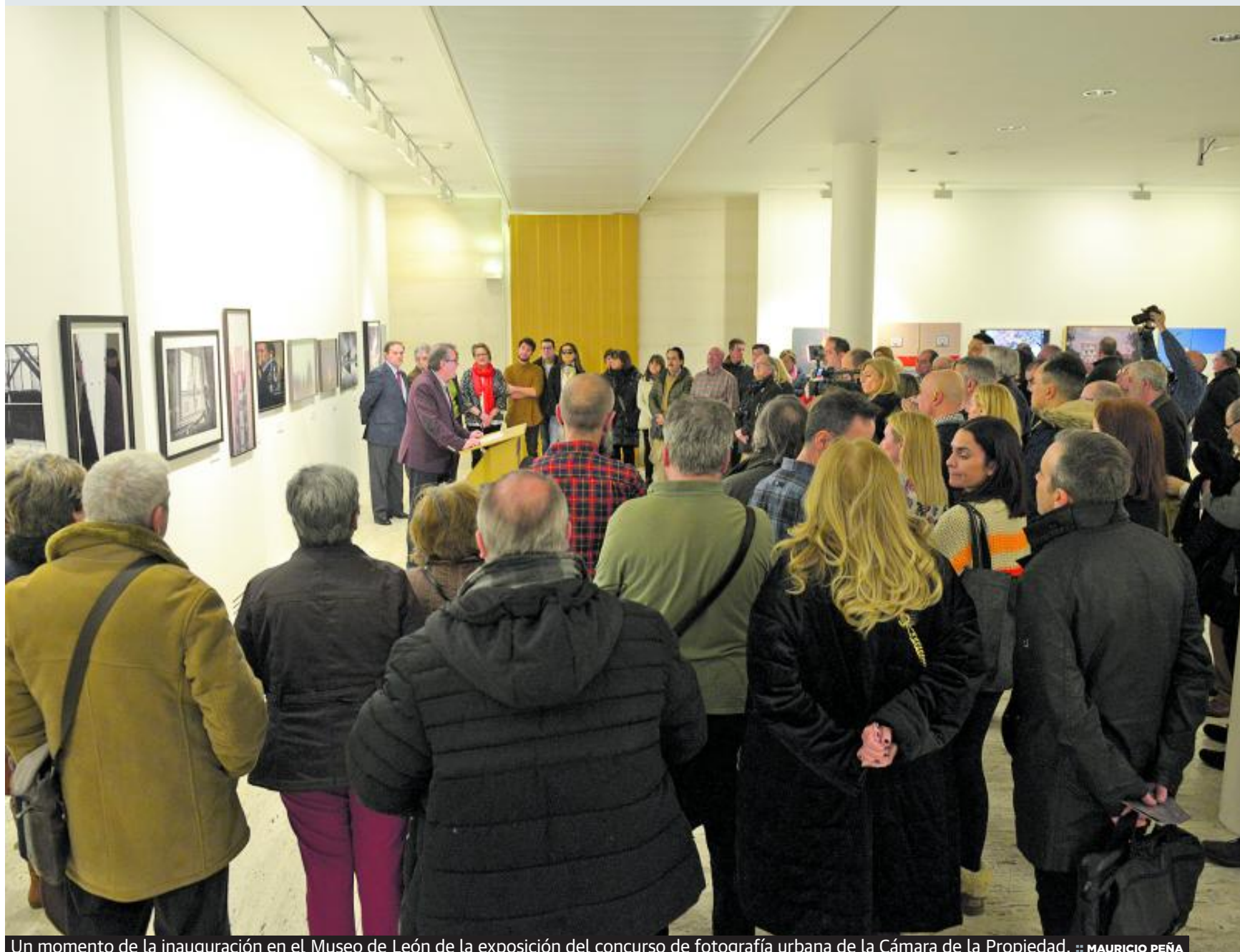
Un momento de la inauguración en el Museo de León de la exposición del concurso de fotografía urbana de la Cámara de la Propiedad.